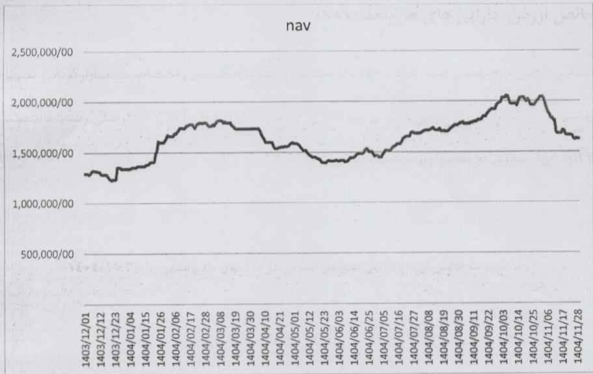
رشد تغییرات خالص ارزش دارایی های هر صندوق در طی سال مالی منتهی به ۱۴۰۴/۱۱/۳۰

خالص ارزش داراییهای هر واحد (NAV) صندوق سرمایه گذاری اختصاصی بازارگردانی سینا بهگزین در پایان سال مالی منتهی به تاریخ ۱۴۰۴/۱۱/۳۰ به ۱۶۲۷.۹۱۴ ریال رسیده است. NAV این صندوق در نمودار زیر ترسیم گردیده است.